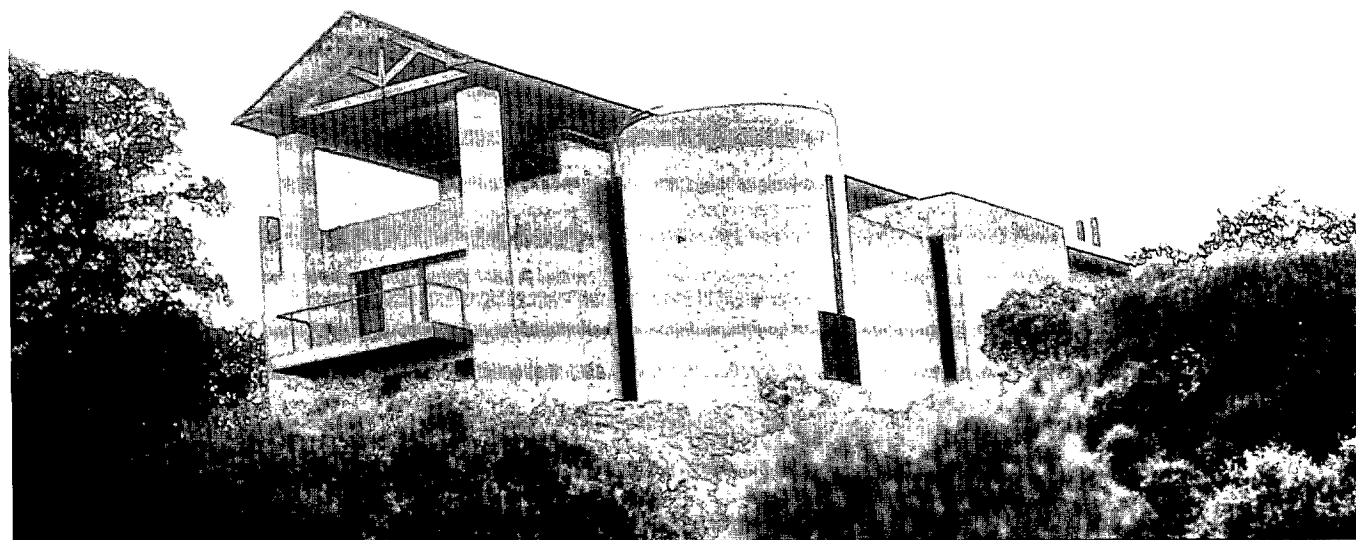
Casa Vallejo-Nájera. Talavera de la Reina.