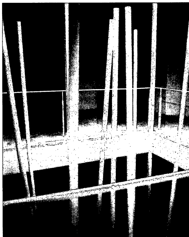
Rehabilitación de edificio para Centro Cultural en Socuéllamos, de J. A. Ramos Abengozar e I. Vicens Ugalde.

Y esa es la otra posibilidad de las dudas y de las incertidumbres. El premio como premioso. Algo tan ajustado y apretado que difícilmente se puede mover; también lo que se expresa con dificultad. No son los trabajos premiados, torpes en la dicción o en el enunciado lingüístico; son el síntoma que confirma la regla: la Arquitectura premiosa versus la Arquitectura Premiada. Esto es, la Arquitectura como sobrevalor frente a la falta de soltura y de espontaneidad de los acontecimientos arquitectónicos. Pese a este desvanecimiento, el empeño colegial por