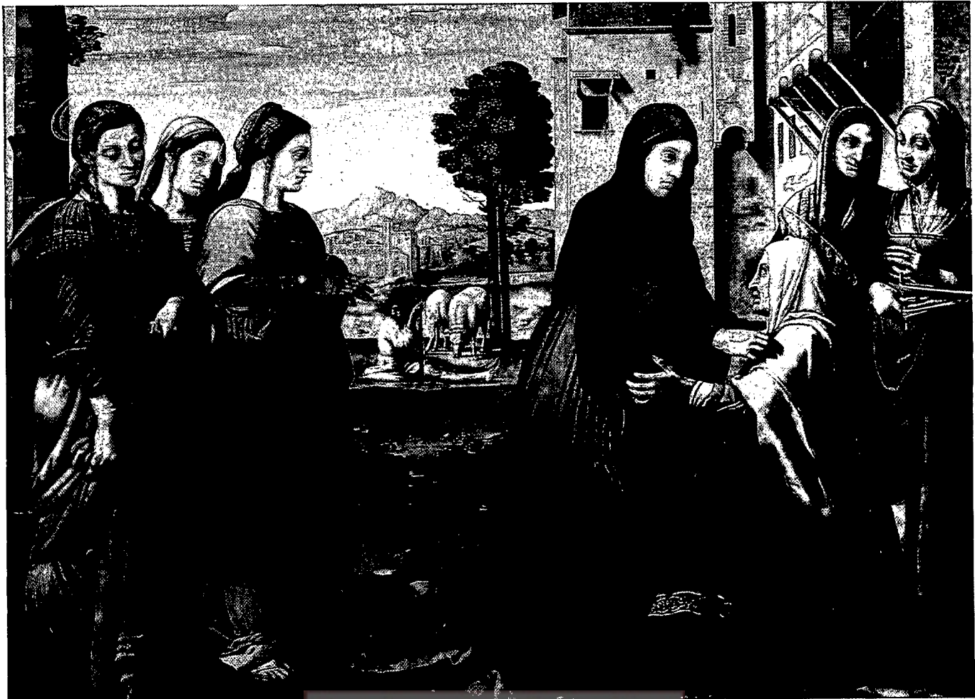
Arriba: Natividad de Santa María, de Fernando Llanos. Abajo: La visitación, de Fernando Yáñez de la Almedina.