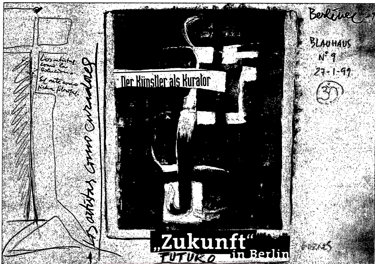
Miguel Barnés: "Zukunft in Berlin", Serie Berlín, 1999.