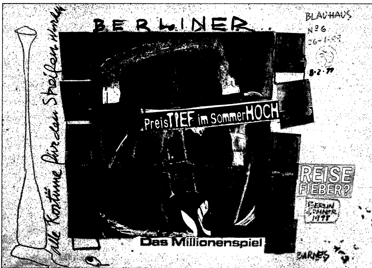
Miguel Barnés: "Reise Fieber", Serie Berlín, 1999.