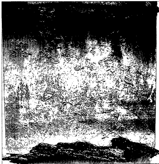
Miguel Barnés: Agua, 1999.

da con el lenguaje fotográfico (principalmente por el encuadre y el color); abandona los grandes formatos y el óleo. Sus ansias creativas se recogen en cuadernos, en los que utilizando la acuarela y los lápices realiza un registro sentimental de los seres que le rodean en este olvidado y pobre país africano.