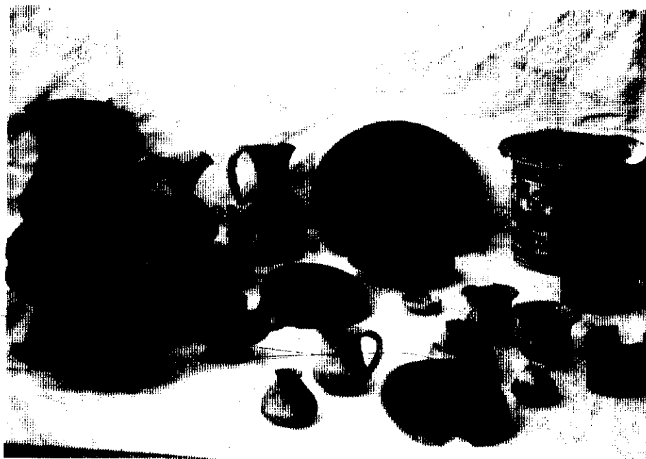
Fig. 3. Conjunto de cerámicas ibéricas y de barniz negro del Puntal dels Llops (Olocau).