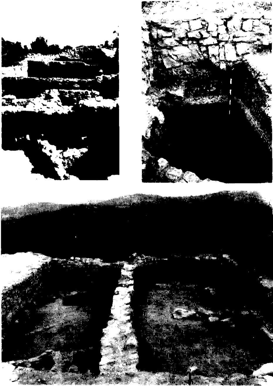
Lám. I. 1: Vista del sector de viviendas excavadas en el Puntal dels Llops; en primer término, nivel del Bronce del Dp. 2 (Campaña 1982). 2: Detalle de la estratigrafía del Puntal dels Llops (campaña de 1980) en el que se aprecia, por debajo del muro ibérico, el nivel de la Edad del Bronce, el suelo correspondiente a éste y la capa estéril sobre la roca. 3: Vista de los departamentos 2 y 3, el primero de ellos en el nivel del Bronce (campaña 1981).