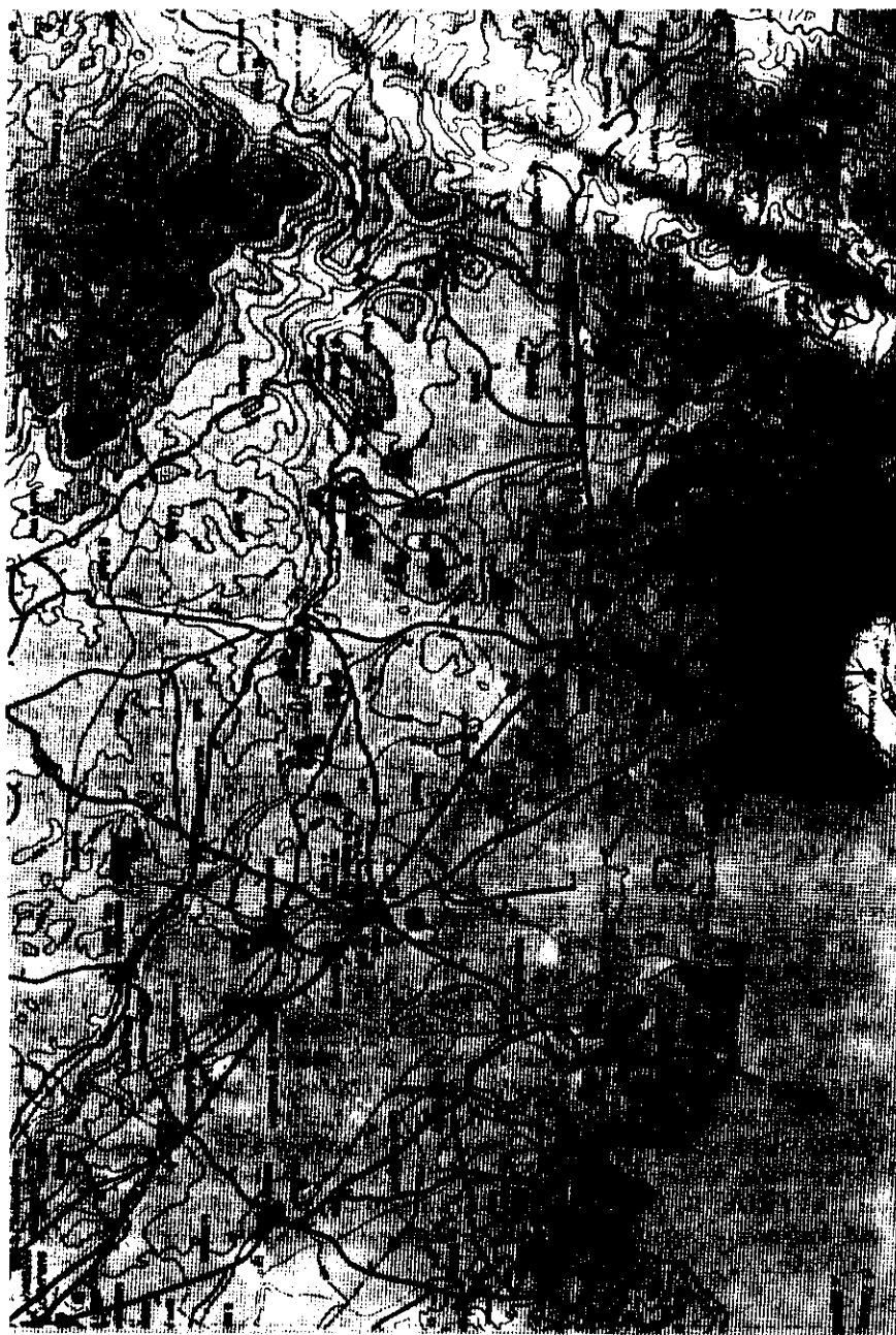
Fig. 1. Mapa de yacimientos ibéricos del llano de Llíria.