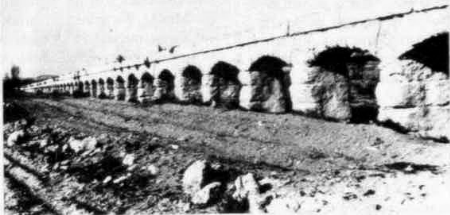
Vista parcial desde el lado Sur.