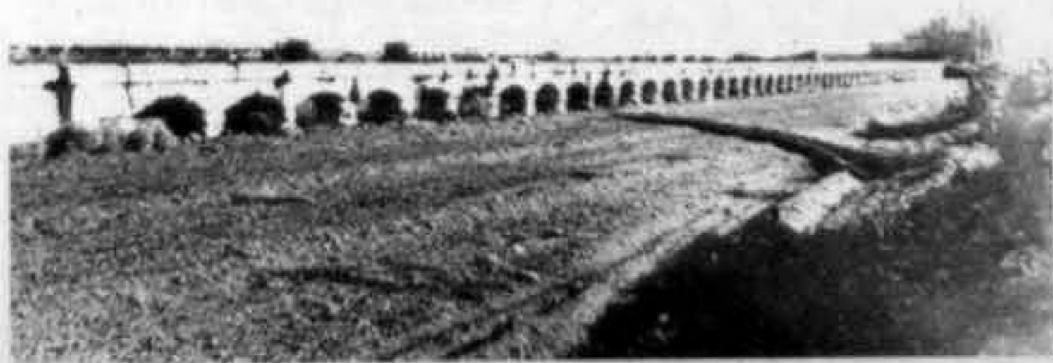
Vista parcial, desde el arranque del primer arco.