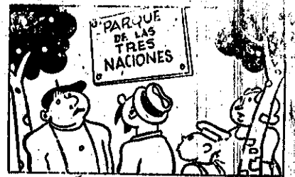
— Y se puede saber por qué le han puesto ese nombre. — Pues porque aquí todo es "nacional".

Semanario Comunista del Comité Provincial de Albacete