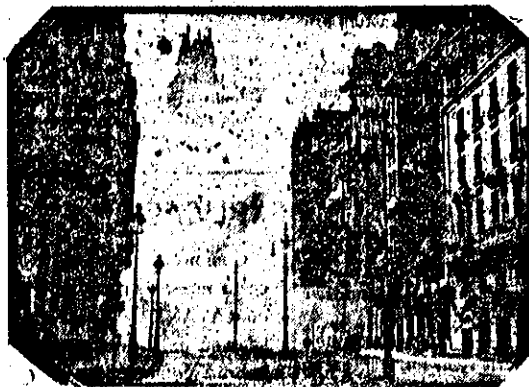
El fascismo venga sus devotas disparando obuses sobre Madrid. He aquí el momento de hacer explosión uno de estos, en la tan martirizada telefónica.