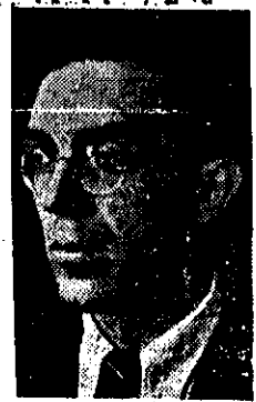
El camarada Jesús Hernández, al que toda la juventud española quiere y respeta por la magnífica labor que para ella viene realizando al frente de su Ministerio.

Esperamos que tomando el ejemplo de Valencia, el Frente Popular de nuestra provincia, trabaje con más actividad que hasta aquí, y sea la base, sobre la que poder resolver todos los problemas que la guerra nos tiene planteados.