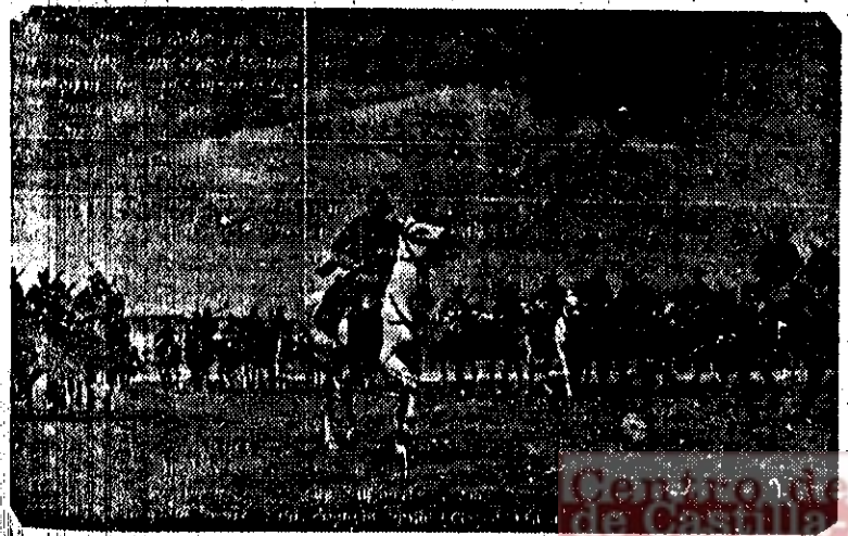
Nuestra caballería iniciando una descubierta sobre el enemigo en uno de los frentes del Sur.

Todos los trabajadores de nuestra provincia deben prestar su más entusiasta y decidida ayuda para que nuestros buenos deseos sean en breve una gratitud real.