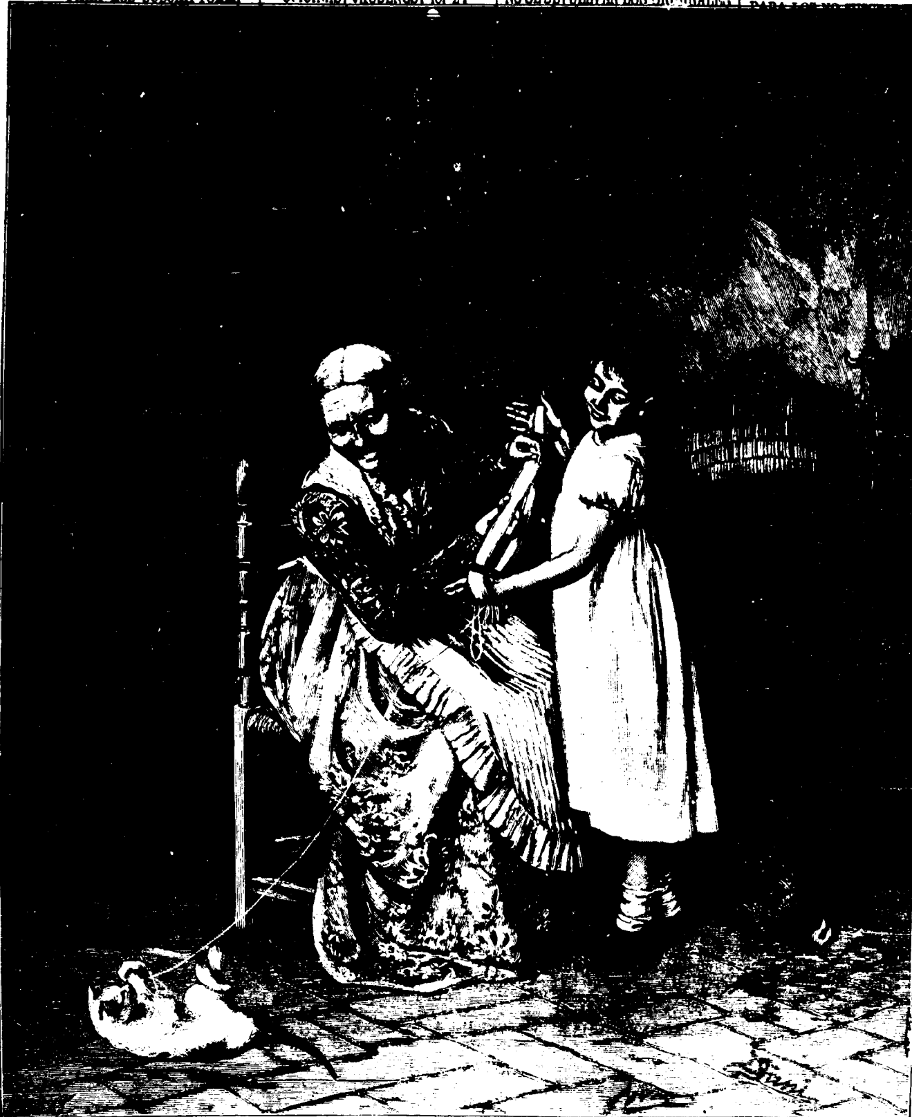
EL ENREDADOR DE LA CASA