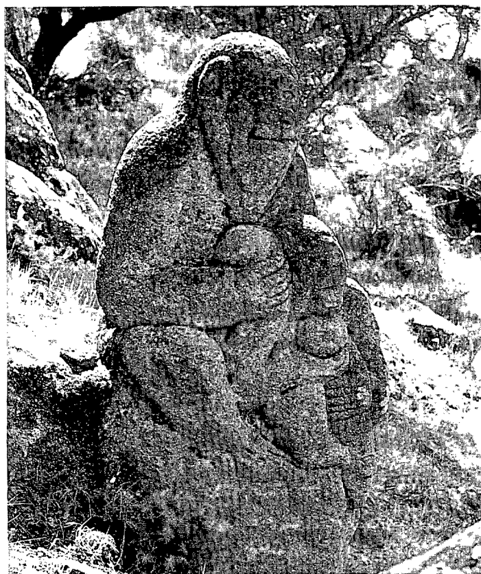
Gorilas en la cuenca del Tiétar.