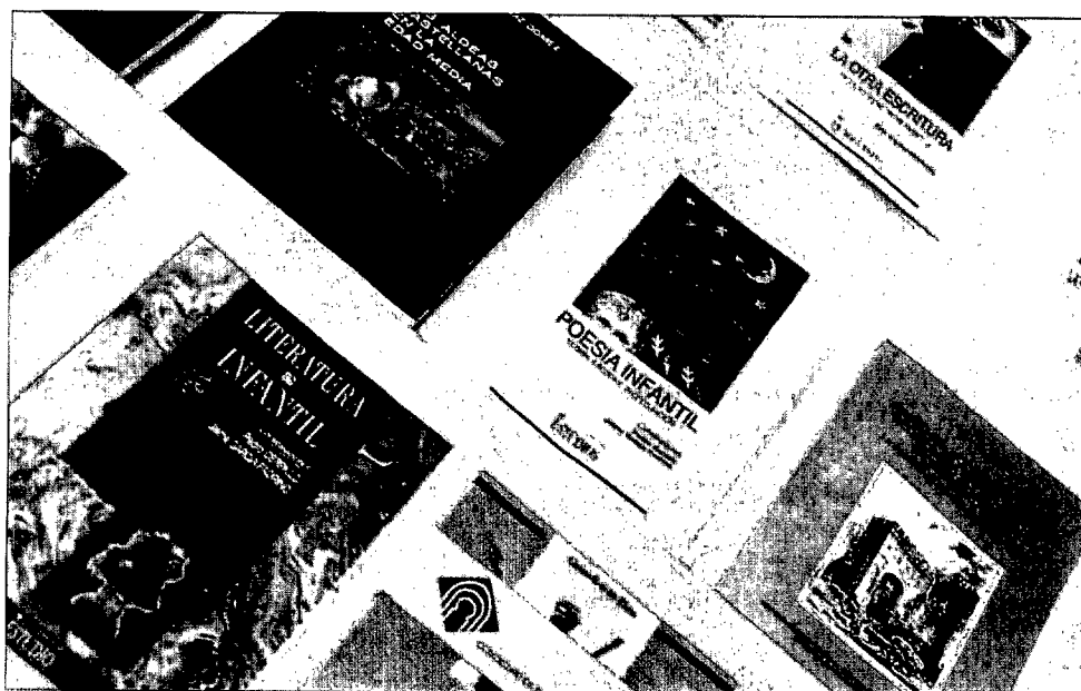
Algunas publicaciones de la UCLM.

R.—En general buena, pero curiosamente más entre gentes de fuera de nuestra Universidad y de nuestra región; nos gustaría que se hubieran adquirido más ejemplares por profesores y por personas que viven en esta comunidad. No obstante, aprovecho para decir que, personalmente, estoy convencido que estas coediciones prestigan a una institución; hay algunos detalles que lo pueden demostrar: nuestra presencia (junto a las universidades de Univespaña) en las Ferias del Libro de Madrid, o de Barcelona, o de Francfort, o en el Liber, se ha notado mucho más gracias a ese magnífico libro, sobre el que pregunta y se interesa muchísima gente; o las peticiones realizadas por bibliófilos. Espero que, si todo va bien, pronto podamos tener una coedición parecida, aunque yo creo que será aún mejor. ■