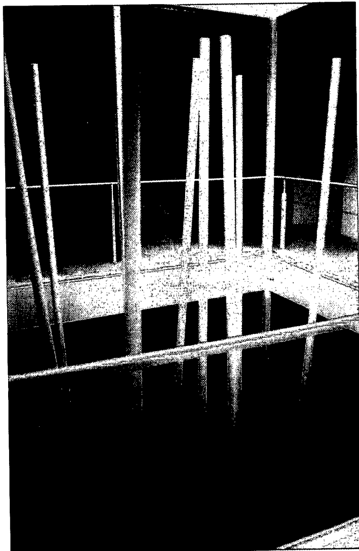
Rehabilitación de edificio para Centro Cultural en Socuéllamos, de J. A. Ramos Abengozar e I. Vicens Ugalde.

Junto a ello, o frente a ello, la cosecha del 95 ofrece a los solos efectos estadísticos una mayor densidad cuantitativa. Frente a las convocatorias precedentes del Colegio de Arquitectos de CCM de 1986 y de 1989, ésta que comentamos arroja un saldo notablemente superior de elementos presentados y seleccionados. Claro que si advertimos la ausencia del año mágico de 1992, el equilibrio numérico se restablece al promedio de la quincena de piezas por trienio. El panorama, finalmente, también se clarifica. En diez años la recolección de obras seleccionadas asciende a 73 elementos; esto es, a una media de 7,3 elementos construidos, dignos de ser tenidos