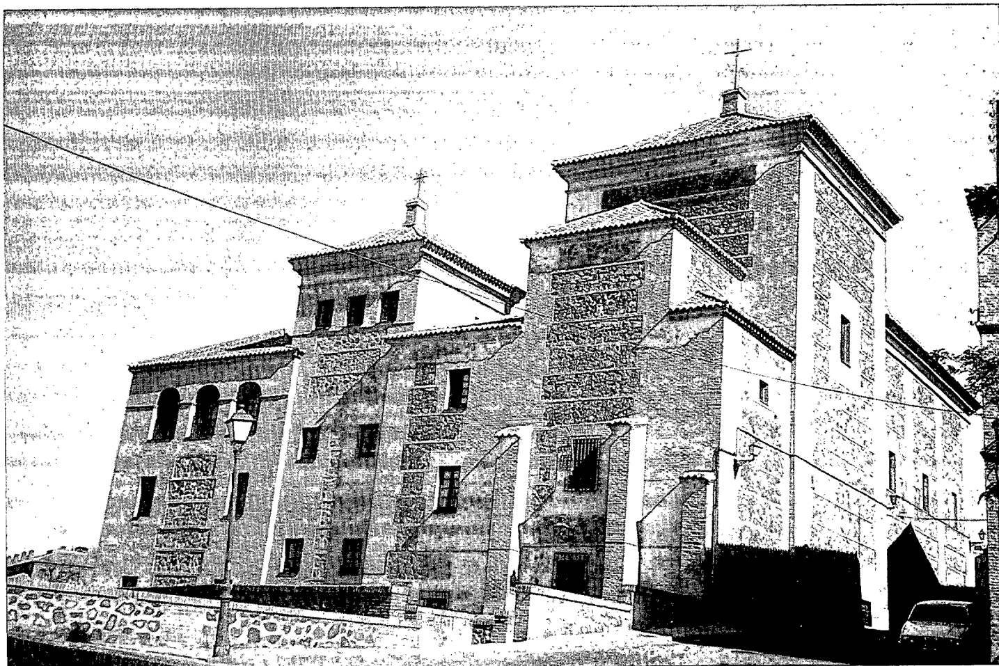
Toledo. Convento de San Gil. Cortes de CLM.