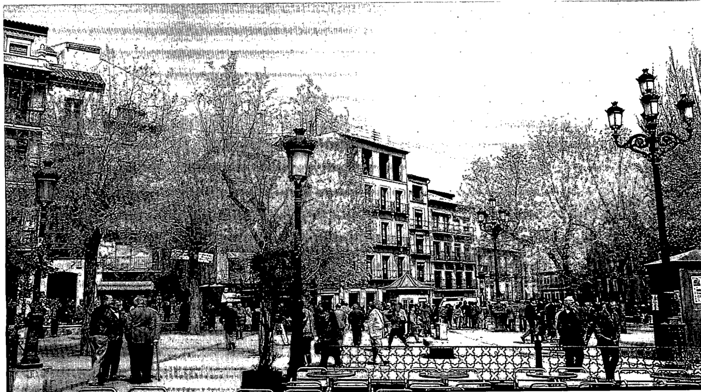
Toledo. Plaza de Zocodover.