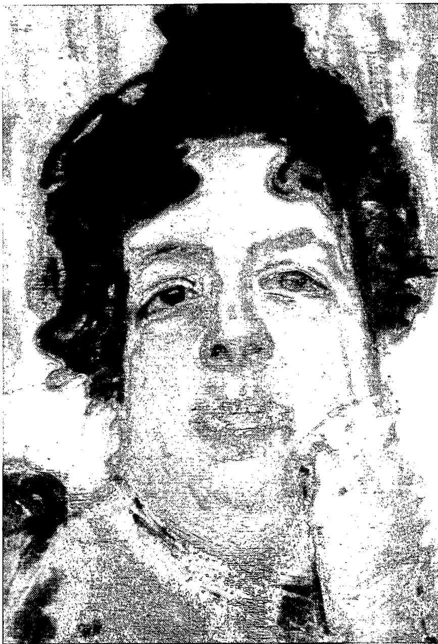
José Joaquín Cuerda Losa, Mujer de rojo . 1900, o/lienzo, 42 x 27 cm. Firmado: J. C. 900. Colección de la familia. Albacete

Desde el mismo momento en el que, a través de propuestas krausistas y luego institucionistas, se defiende el valor de la educación artística como medio de progreso social, surge la diferenciación entre arte bello y arte bello útil, siguiendo la terminología utilizada por Francisco Giner de los Ríos 6 . Las artes industriales surgen, pues, como medio propuesto por la ideología regeneracionista. La Escuela de Artes Industriales de Toledo (inaugurada en 1902) es la primera en crearse y la primera que revitaliza la defensa de las artes industriales toledanas. Surgen, pues, proyectos regeneracionistas que parten de un sector de la sociedad político-liberal e intelectualmente comprometido. Como resultado de esta ideología surgen, sobre todo en Toledo, Guadalajara y Albacete, diferentes medios de