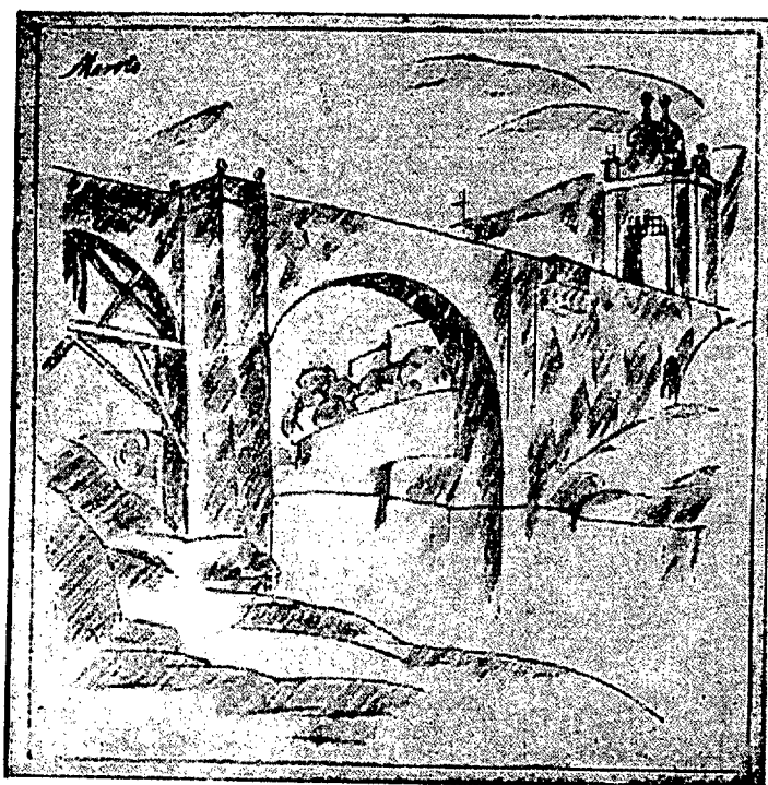
Gabriel García Maroto. Toledo . Litografía. Repr. en Toledo visto por Maroto , Madrid, Imprenta Maroto, 1925.

Bellas Artes e Industrias Artísticas de Toledo (1929), todo un panorama expositivo que reunió a todos los representantes plásticos regionales y donde participaron algunos pintores y escultores asiduos del ambiente artístico madrileño. 7