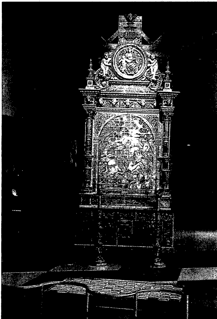
Retablo de Santiago.