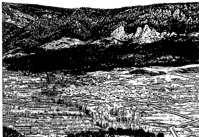
Vista de Cañamares.

Todavía pueden encontrarse áreas verdes y zonas recreativas como las Dehesas de Sotos, Cañamares, Fresneda o Villalba de la Sierra, cotos de pesca especialmente ricos en trucha como el del Escabas en Cañamares o el del Júcar en Villalba.