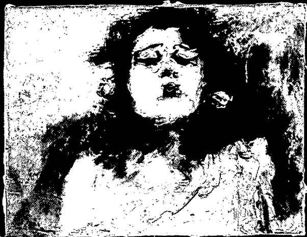
1998. Descanso de un torero ausente. Cuerpo de folklóricas pertenecientes al mismo montaje. 33 x 37 cm. y 24 x 22 cm. Técnica mixta sobre tela.