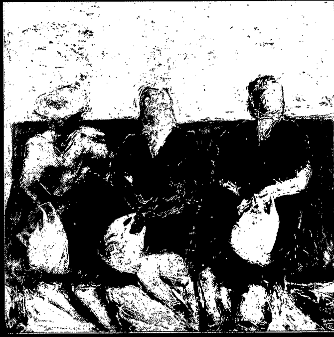
1998. Mujeres en espera... técnica mixta sobre lienzo. 200 x 200 cm.