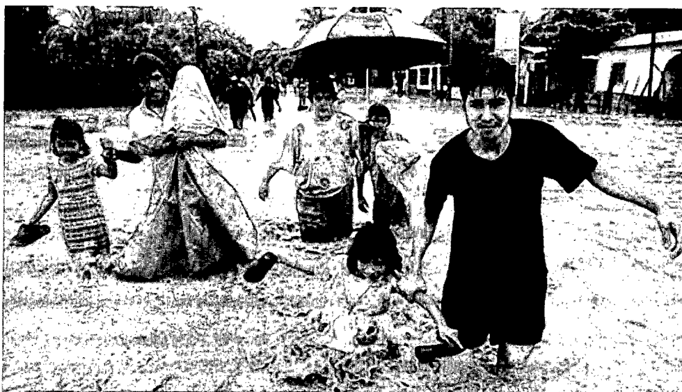
Familias abandonando sus hogares en Honduras, tras las inundaciones.