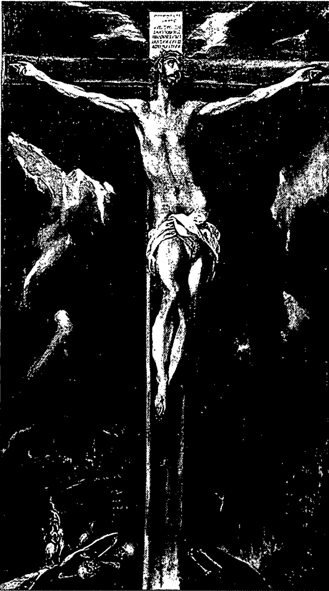
Taller de El Greco. "Cristo Crucificado" ca. 1610. 66 x 38 cm. Museo de Santa Cruz. Toledo.