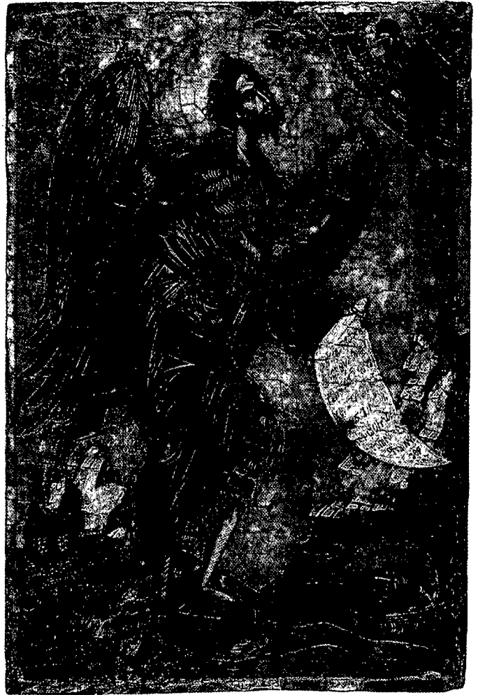
San Juan Bautista, icono griego de principios del s. xvi.