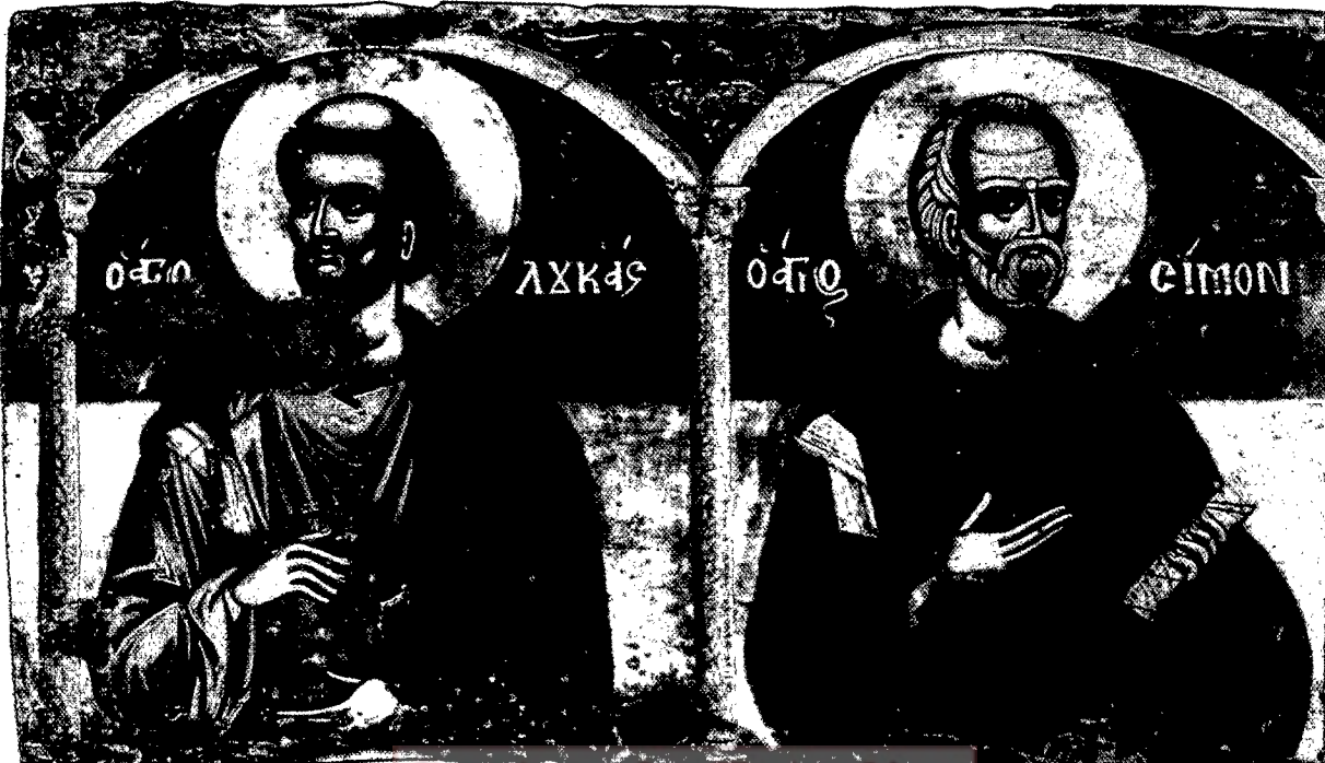
San Lucas y San Simón, icono griego de 1627/28.