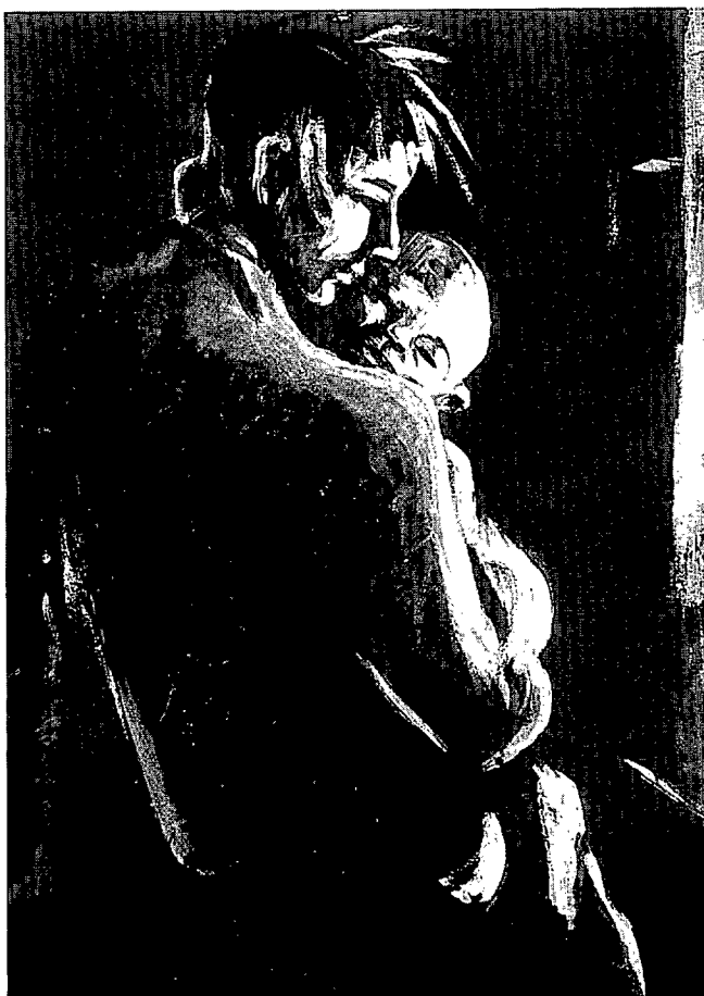
«Ternura azul», de Ana Agudo

Nuestros pueblos y ciudades, nuestra sociedad en general, pueden seguir abriendo puertas, posibilidades, horizontes, destinando tiempos y espacios amigables con los niños y niñas; pueden tenerlos en cuenta en el diseño de sus casas, escuelas o