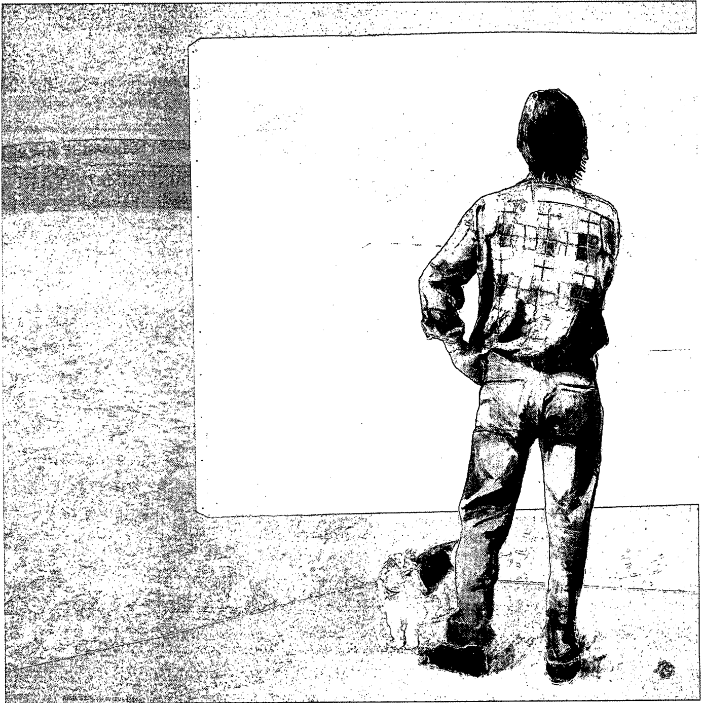
Detrás de nosotros. 1990.