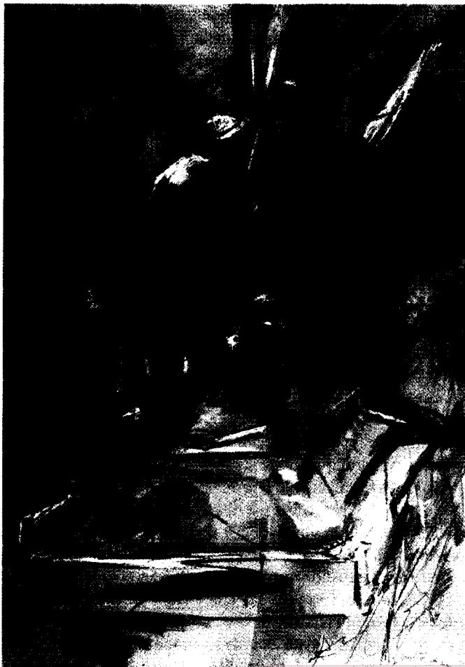
Nuestro Padre Nazareno a las ocho de la mañana. Miguel Ángel Moset. 2000.