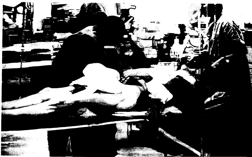
Víctimas de bombardeos serbios a zona croata por encima de las posiciones bosnias en Mostar. Simeón Saiz Ruiz. Óleo sobre algodón, 241x 390 cms. 1996.