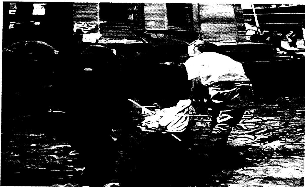
Matanza de civiles en Sarajevo por proyectiles caídos junto al mercado principal el lunes 28 de Agosto de 1995. Simeón Saiz Ruiz. Óleo sobre algodón, 170 x 275 cms. 1996.