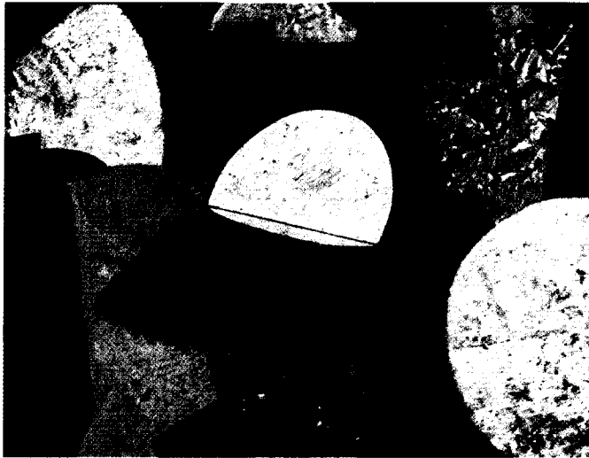
Tambor del Viernes Santo. Keko Mataki. 2000.