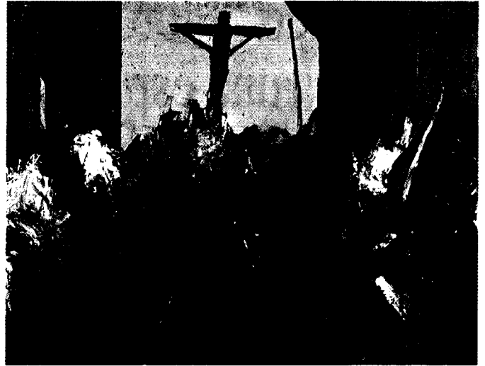
Salida de Jesús de las seis. Miguel Zapata. 1979.