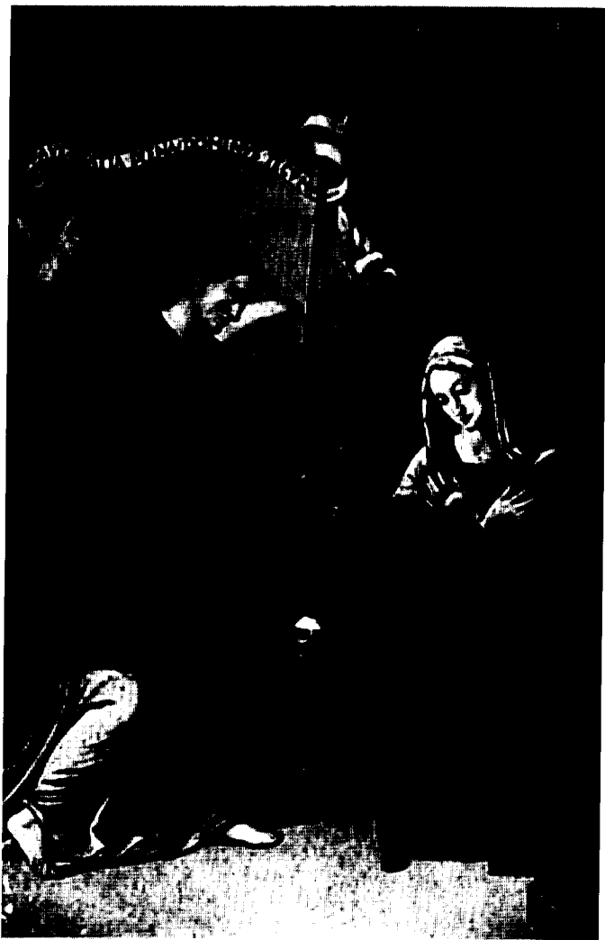
Anunciación, del Maestro de Albacete (S. XVI)

La Edad Moderna, estilísticamente, nos ofrece el Renacimiento y el Barroco hasta el Neoclasicismo, con dos momentos brillantes, uno en el siglo XVI y otro en el XVIII; en el primero de ellos la pintura nos trae obras tales como el "Noli me tangere", de Chinchilla, que muestra, claramente, el tránsito del gótico a los nuevos tiempos; las obras del Maestro de Albacete, de equilibrado sosiego renacentista, continúan para alcanzar su culminación en el "Cristo abrazado a la Cruz" de El Greco (El Bonillo), con el que se rompe el clasicismo.