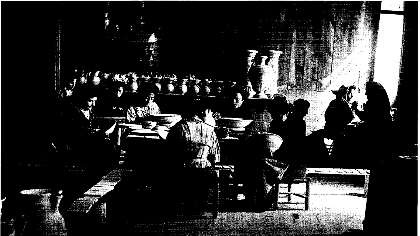
Ruiz de Luna: Taller de alfarería, Talavera hacia 1910.

des núcleos urbanos en los que sustentar un crecimiento de las actividades no agrarias. Toledo capital es una sombra de la ciudad que fue a mediados del siglo XVI.