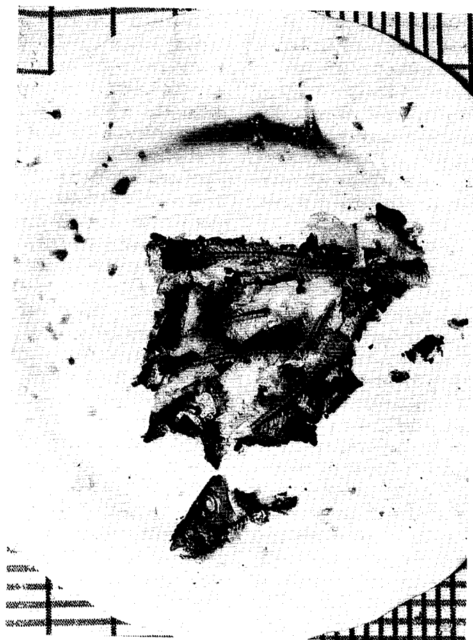
Javier Baldeón: Atlas (2000).

De este modo, entre «cuadros manchados», pueblos «andantes», silencios, melancolías, fantasías y desvaríos, entre paisajes de luz y bodegones caseros o pájaros de tierra, se ordenan en