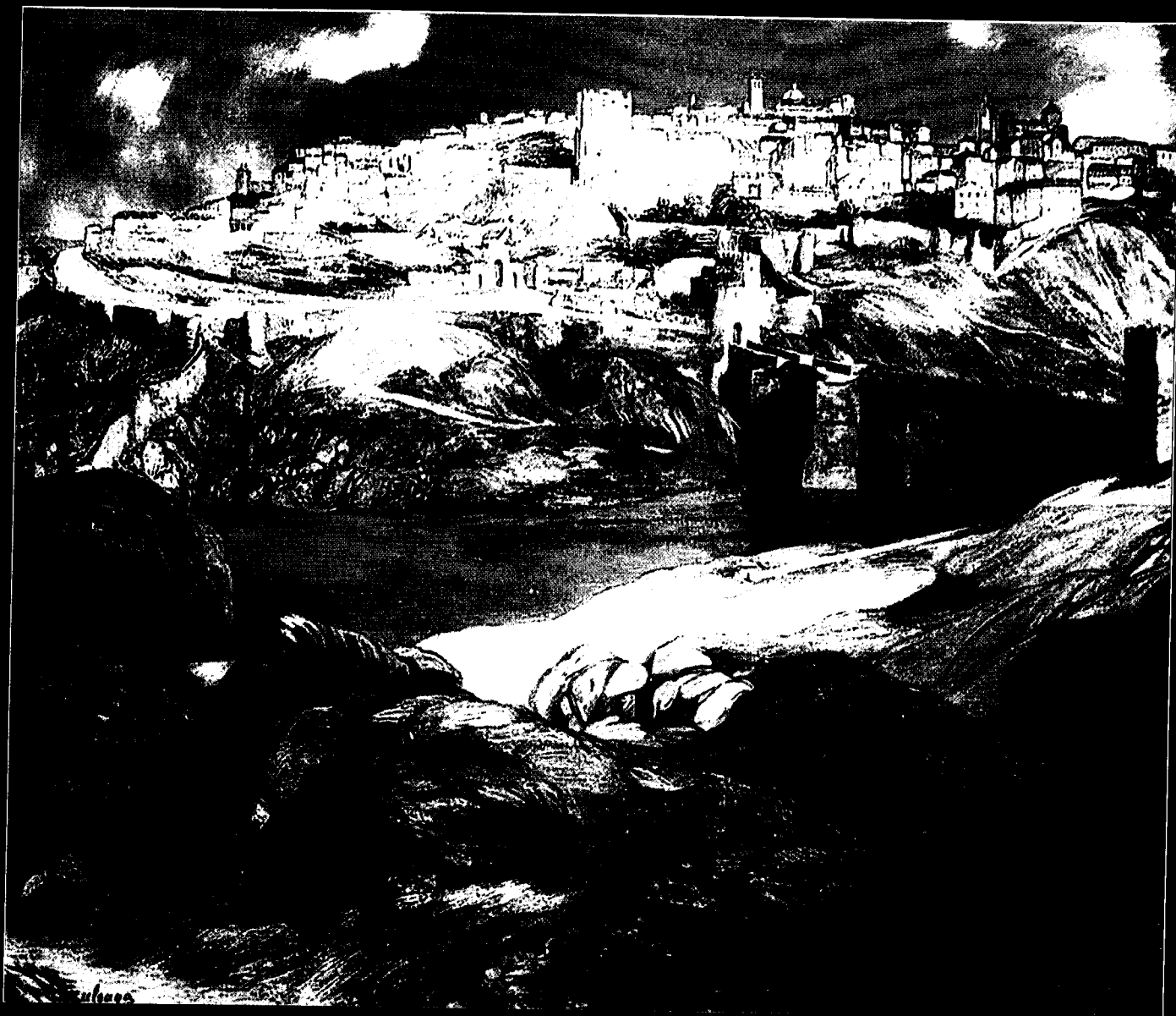
Ignacio Zuloaga: Vista de Toledo (hacia 1900).