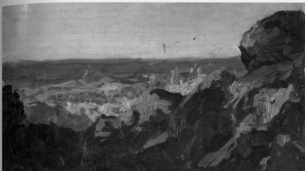
Enrique Vera Sales Vista de Toledo desde promontorio rocoso Óleo sobre lienzo adherido a cartón, 27,2 x 37,4 Inv. 88