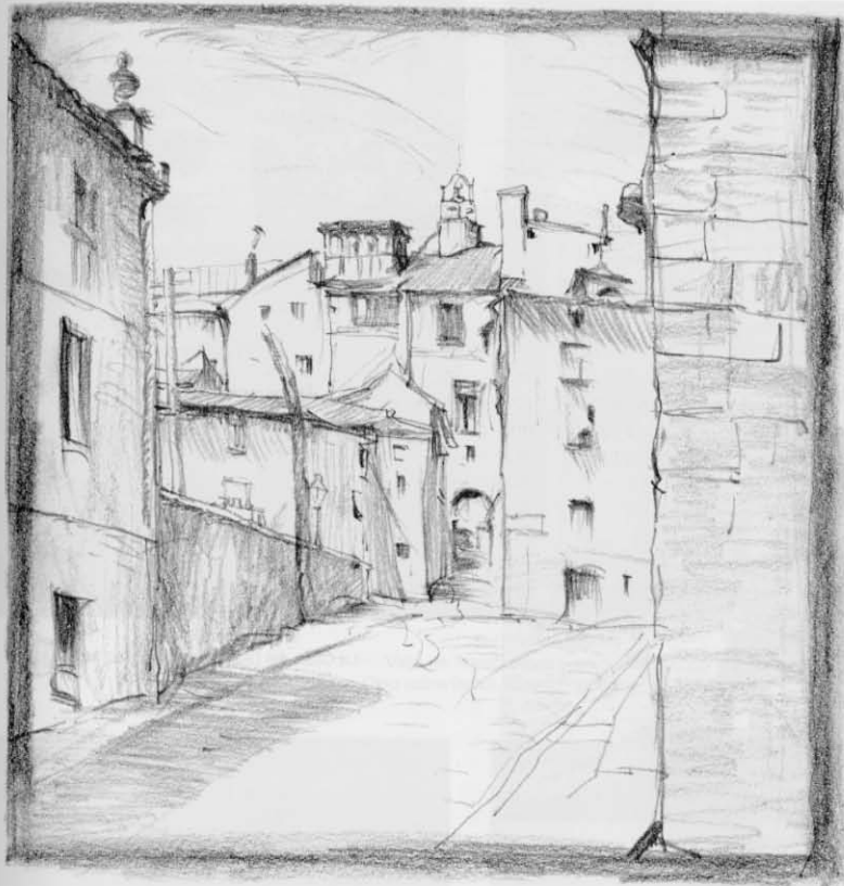
Enrique Vera Sales Cuesta de Cervantes con la Casa de Caridad y Arco de la Sangre. ca. 1927 Lápiz s/papel, 210 x 166 mm sign. b141. Inv. 507

Entusiasmo y frescura son rasgos comunes a las obras austriacas y toledanas de Enrique Vera, reproducidos de uno a otro escenario sin apenas solución de continuidad, cuando la guerra europea y los compromisos adquiridos le han devuelto a su ciudad natal. El Ayuntamiento expuso aquellos cuadros, cosa extraordinaria e inédita en Toledo hasta entonces, en las ferias de 1914. Una crítica realmente neófitá, que acababa de estrenarse en las celebraciones del Centenario de El Greco, halló un pintor moderno, de sentimiento atento a la naturaleza cambiante de la luz, pero tratando de atemperar sus señas de modernidad, tal vez en conjuro de los desconocidos efectos que éstas pudieran haber tenido. “No abusa de los modernos procedimientos pictóricos”, decían, alabando la valentía de quien “rechaza los viejos convencionalismos”. En esta temprana percepción de su carácter ecléctico, se advierte una primera formulación de la estética del compromiso que se irá sucesivamente reformulando, y marcará decisivamente la mayor parte de su carrera artística.