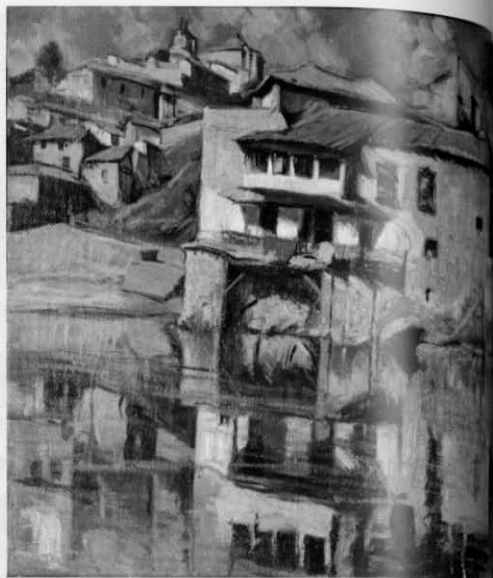
Enrique Vera Sales La Casa del Diamantista, ca. 1927 Óleo sobre lienzo, 64,5 x 76 Inv. 174