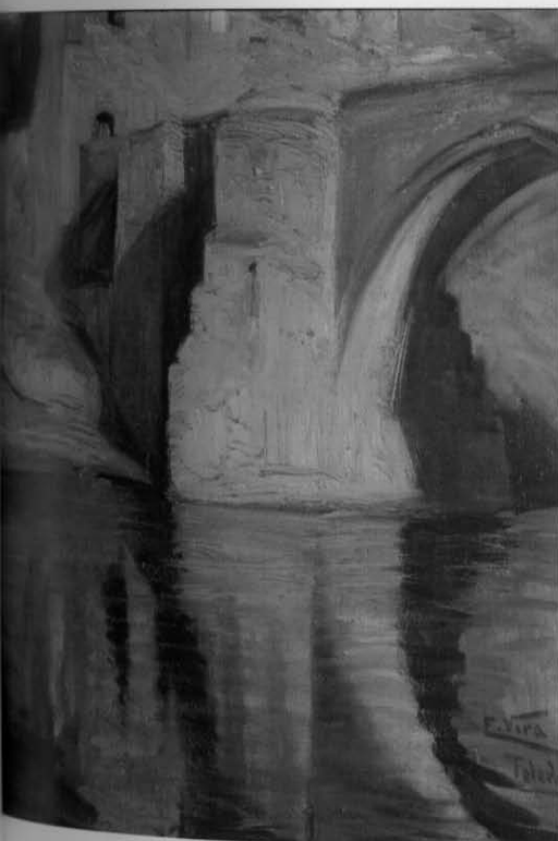
Enrique Vera Sales Puente de San Martín, ca. 1928 Óleo sobre lienzo, 60,0 x 46,0 Inv. 166