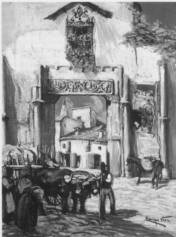
Enrique Vera Sales Puerta del Corral de Don Diego. 1927 Gouache sobre papel adherido a cartón, 47 x 32 Inv. 196