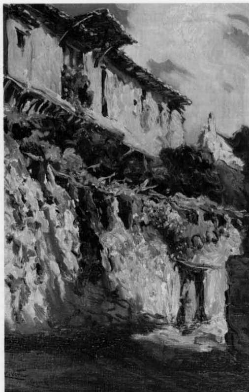
Enrique Vera Sales Cuenca, ca. 1918 Óleo sobre lienzo adherido a cartón, 49,7 x 31,0 Inv. 125

ción de negro. Era la escala lineal del gris, que organizaba los "colores incoloros", sistemáticamente distintos de los "plenos" o "coloreados". Vera recomendaba especialmente estudiar la teoría del color de Ostwald en sus programas, en función de la cual caracterizó el arco cromático toledano, con "ese color sin color que son los grises". En el pequeño tratado que en 1929 fue su discurso de ingreso en la Academia de Bellas Artes — Toledo en su aspecto pictórico — fijó Vera su percepción sobre el "tono toledano", resolución del "teorema cromático" que le ocupó durante años ante la imagen de la ciudad, con el gris básico de su pátina de antigüedad, y la variedad de tonos de su "sinfonía de plata", brillante y luminosa por efecto de la intensidad local del sol. Con tan original aplicación de la escala del gris, Vera acabaría alcanzando la unidad de visión que tantas veces le fuera reclamada.