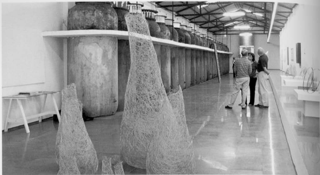
Vista general de la sala de exposiciones.