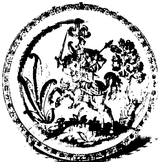
Plato de cerámica con motivos caballerescos