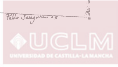
Ilustración de Pablo Sanguino