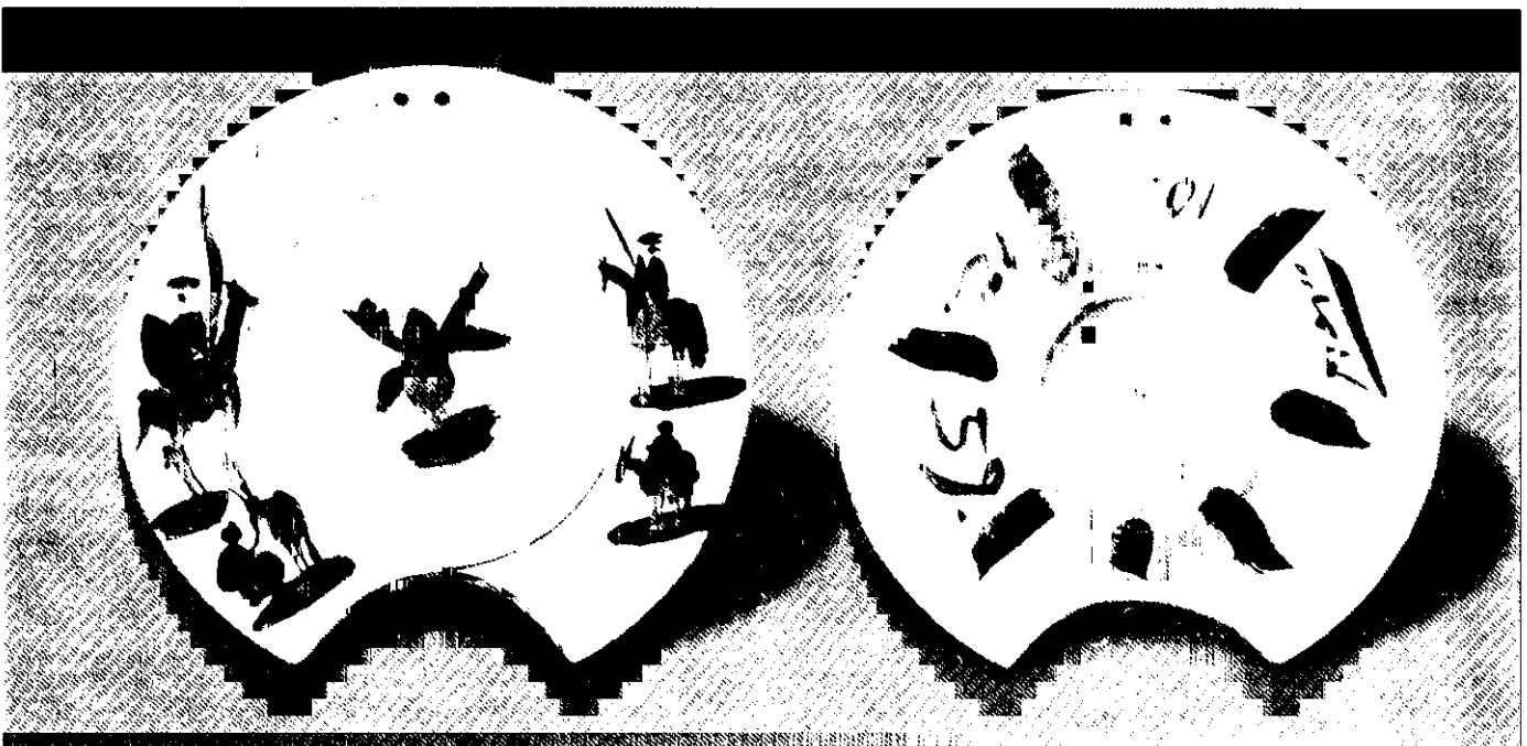
Dos platos de cerámica de Pablo Picasso

a los famosos personajes cervantinos con fidelidad que, en su radical síntesis, resulta insuperable. Hace falta una gran maestría para dar de manera tan sucinta y esencial todo lo que hemos ido viendo a lo largo de esta galería de evocaciones qui-