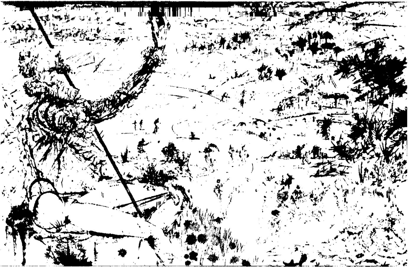
Ilustración de Salvador Dalí para el Quijote.