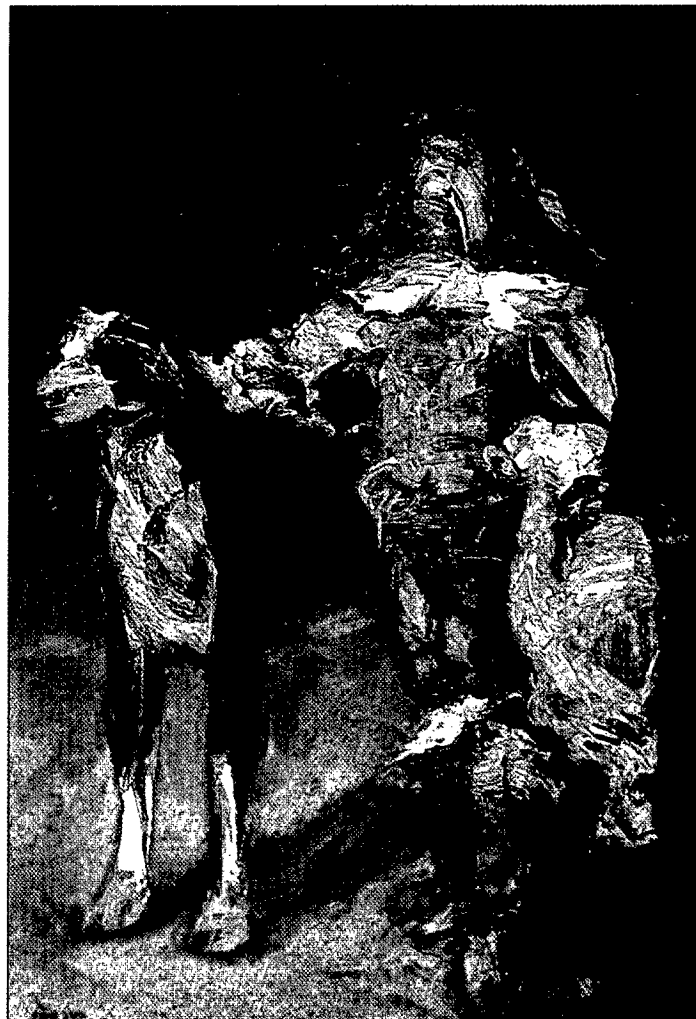
Inglés con perro. 1968