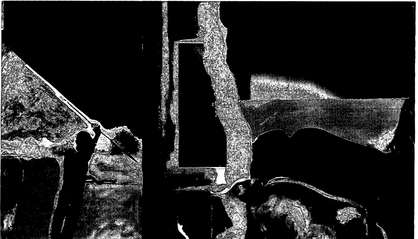
Boceto para rebelión en Africa (1978).

Posteriormente se siente atraído por Velázquez y El Greco, de algunas de cuyas obras efectúa personales recreaciones. Obtiene diversas distinciones en su etapa parisina, y tras su regreso a España (1977) realiza más de una veintena de exposiciones individuales en nuestro país, así como en Venezuela y en Moscú.