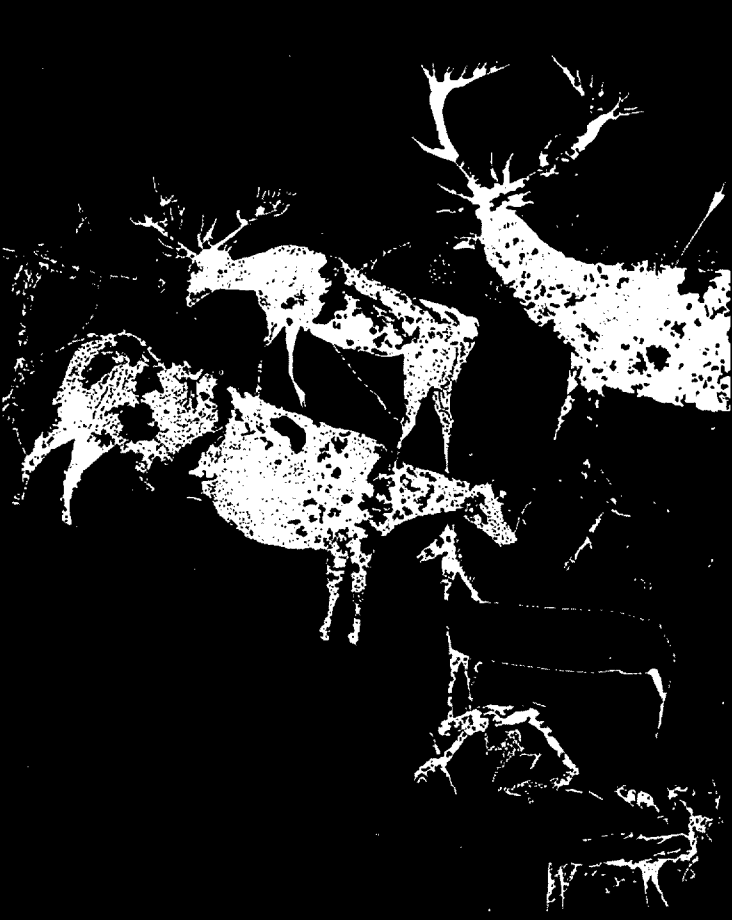
Solana de las Covachas. Nerpio (Albacete).