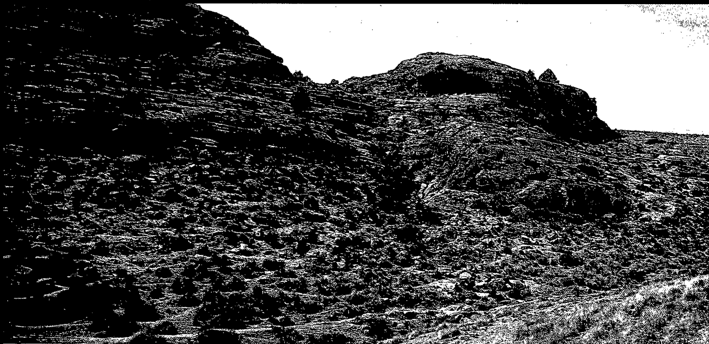
Minateda (Hellín): Abrigo grande.