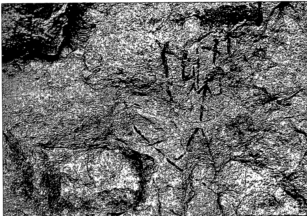
Nerpio: Torcal de las Bojadillas.

E n principio, la propuesta que se empezó a elaborar, sólo preveía solicitar la inclusión en la lista indicativa del Arte Levantino. Pero, poco a poco, y a medida que el proyecto se ponía en marcha, aumentó el convencimiento de los promotores, las seis comunidades autónomas antes citadas, sobre la idoneidad de ampliar a otras manifestaciones rupestres el campo de la solicitud de Declaración a la UNESCO. No parecía justificada la exclusión de numerosos abrigos pintados que contenían otro tipo de conjuntos pictóricos en un ámbito territorial común, compartiendo a la vez ubicación y paisaje. Finalmente, el documento, bajo el hilo conductor del arte levantino, recoge todos los abrigos