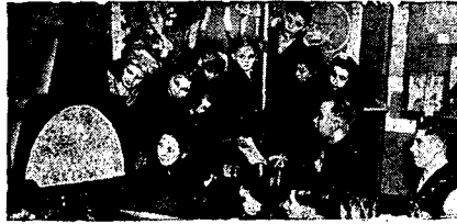
Los niños constituyen el público primordial de la televisión, hoy día, y debido a ello, es preciso aquilatar en gran manera los programas a exhibir.

tuario no son profanadas por el mal uso de la T. V.» La solución está en realizar programas positivamente sanos, con la