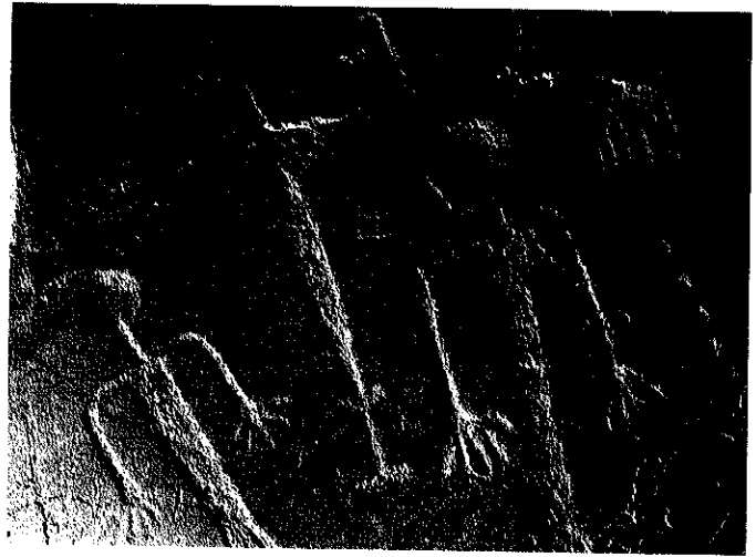
En la Estela de Alamillo se representa una espada similar a las halladas en Puertollano

La representación de un espada de "lengua de carpa" o de "antenas" (por la forma de la empuñadura), aparece en la Estela de Alamillo (Museo Provincial de Ciudad Real), pieza arqueológica fechada en torno a los siglos VIII-IX antes de Cristo. Igualmente, en otras estelas prehistóricas de estos periodos, se representan diversos elementos de la panoplia del guerrero. Junto a un "escudo de escotadura en V" y la lanza, aparece un carro esquematizado, fibulas... En la Estela de Alamillo (también en la Estela de Chillón...), como he referido, se representa una espada del tipo "Ría de Huelva", similar a los ejemplares de bronce hallados en diversos yacimientos peninsulares, siendo la mayor concentración de estas armas, en la franja atlántica. Esto hace pensar que el origen y difusión de esta espadas, habría que relacionarlas con el comercio del estaño del círculo atlántico (Armórica, Islas Británicas, Galicia...), llegando a diversos puntos importantes que sigue la ruta marítima de este comercio (Tajo, cuencas del Guadiana y Guadalquivir, Islas del Mediterraneo Occidental...) donde se adaptan a las culturas del lugar y se dan por otro lado a conocer.