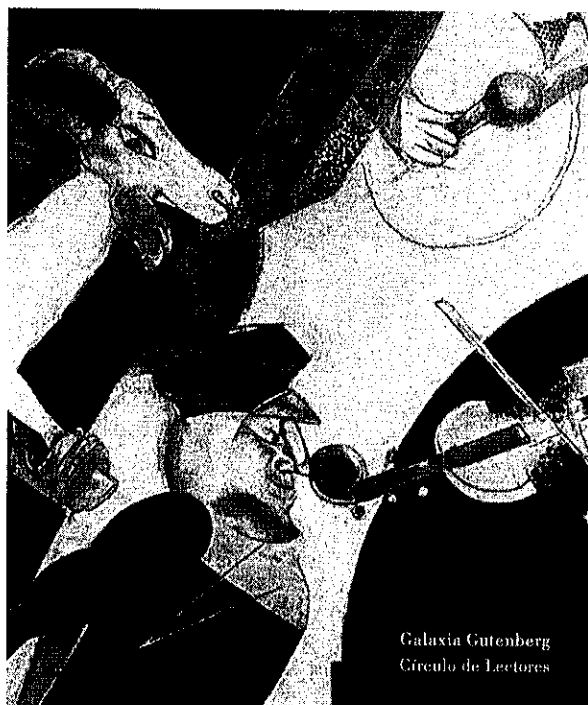
Galaxia Gutenberg Círculo de Lectores

codicia, la injusticia, la delación, la maldad, la soberbia...". Y sin embargo, con esos elementos, se ha ido haciendo la Ciencia, la técnica... Yo me acuerdo ahora de los militantes de base de partidos de izquierdas de los años 50 y 60 que entraban a la cárcel sonriendo y salían con los dientes apretados: sabían que iban a volver. Esta gente y otra mucha gente después, gente muy abnegada, están dispuestos a luchar hasta el final. Son ellos y todos nosotros los que modificamos muy lentamente esas condiciones brutales de los que hacen la historia. Hay que recordar a Camus cuando dijo que "unos hacen la historia y otros la sufren". La historia es extraordinariamente lenta, tenemos que saberlo. Y los que estamos comprometidos con la modificación de las comunidades no podemos contentarnos con la carrera de los cien metros libres, tomar el palacio de invierno... ¡No! La democracia es un camino. Lo dijo con palabras muy hermosas un brigadista internacional que vino a jugarse la vida para defender la República. "La democracia no es un estado de ser de las comunidades, si no un camino. Se está