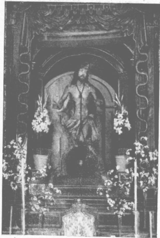
ATIENZA: Cristo del Perdon , de Carmona.